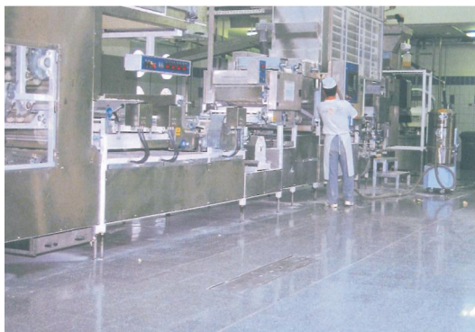
Type BVE Anwendungsbeispiel in der Lebensmittelindustrie

Einbau: Der Einbau muss fachgerecht nach unserer Einbauanleitung erfolgen. Bei wasserdichten Typen ist auf der Baustelle besonders auf einen dichten Anschluss an der Zargenaußenseite zu achten.