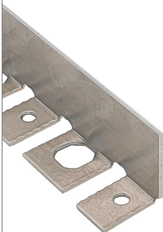
ASM-Profil W 4045-WK A flex

Standardlängen: 3,00 m, Sonderlängen auf Anfrage